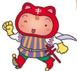
保生の森シールぼうや 選手権1位