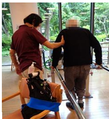
酸素療法時の歩行訓練