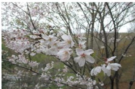
フロア 談話コーナーからの景色